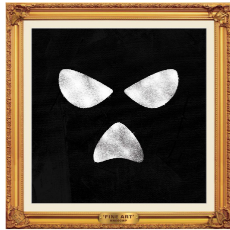
Copertina di Fine Art , Kneecap, che mostra un balaclava incorniciata