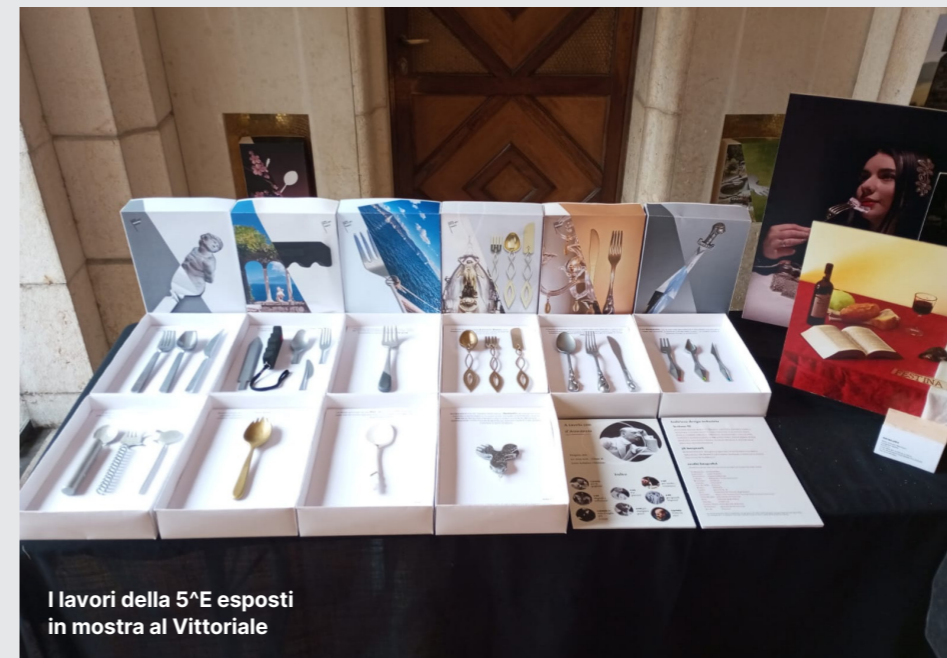
I lavori della 5 E esposti in mostra al Vittoriale