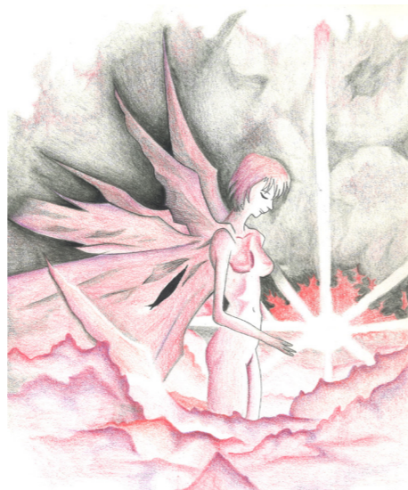
Illustrazione di Noemi Garofalo

movimento continuo al quale dobbiamo permettere di scorrere liberamente. Quanto di noi è disposto a cambiare per continuare a esistere?