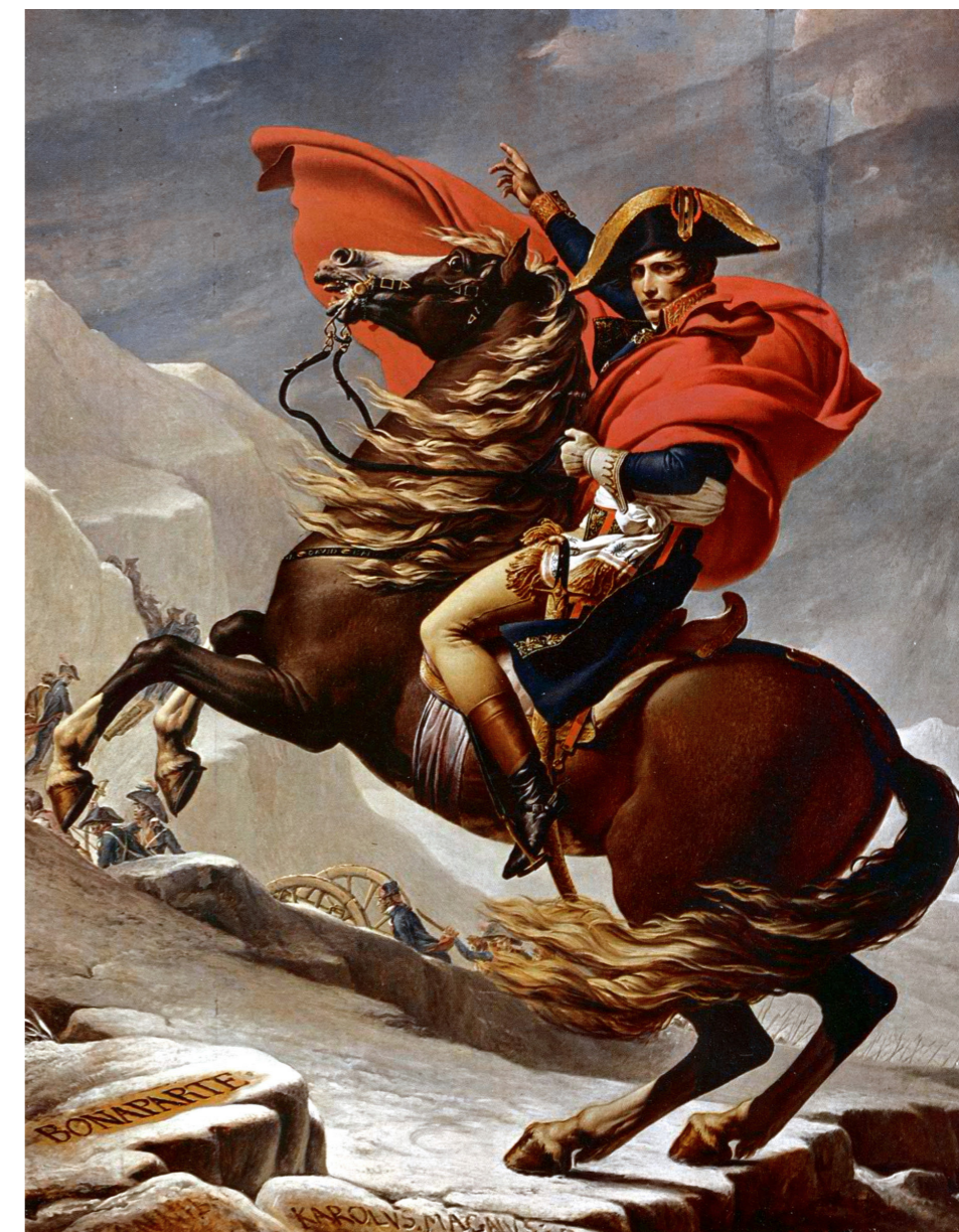
Jacques-Louis David, Napoleone valica le Alpi, 1800-1803, olio su tela, Museo nazionale del castello della Malmaison, Rueil-Malmaison

Alla luce di questo confronto, individuare oggi figure cosmico-storiche risulta problematico. Il mondo contemporaneo è molto complesso: globalizzazione, interdipendenza economica e sviluppo tecnologico rendono difficile attribuire a un singolo individuo le trasformazioni epocali. Eppure, emergono individui che sembrano avvicinarsi a questo modello, come leader politici, giganti del tech (Elon Musk, Mark Zuckerberg,