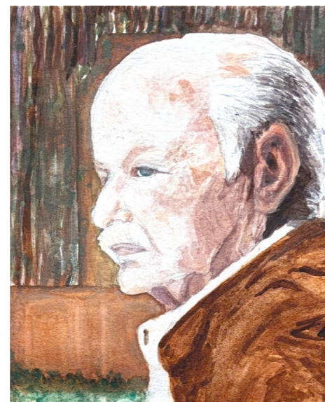
Illustrazione di Letizia Pullara

Una canzone senza tempo, che non smetteremo mai di custodire nei nostri cuori insieme all'anima immortale dell'immenso Gino Paoli.