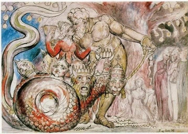
7. Gustave Doré "Paradiso" (1832–1883)