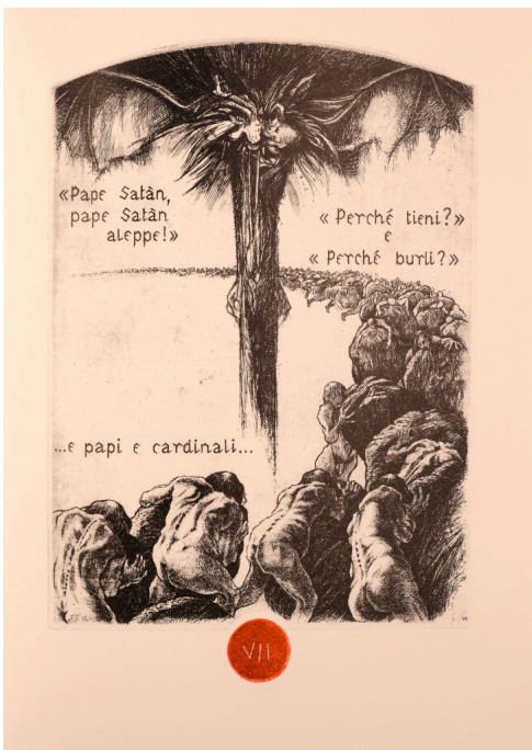
tavola Canto VII

Ferrari sceglie e si impone una assoluta fedeltà al testo. Le illustrazioni sono state selezionate nel 2015 per le celebrazioni ufficiali del 750° anniversario della nascita di Dante: esposte al pubblico in una mostra tenuta a Palazzo Madama.